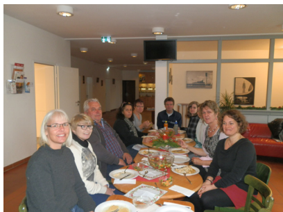
Kochen und Computer. Nach getaner Arbeit wird im KredO-Foyer gespeist.