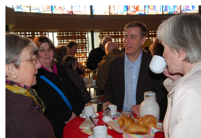
Credo & Croissants: Zeit zum Gespräch über eine biblische Geschichte dieser Art Gottesdienst (F. Merten)

wichtig: Begegnung mit der Guten Nachricht, untereinander und mit uns selber. Darum beginnen wir den Gottesdienst mit einer Tasse Kaffee oder Tee und Croissants. Dazu gibt es während des Gottesdienstes verschiedene Stationen mit der Möglichkeit der Stille und des Austausches. In der Feier des Abendmahls lassen wir uns gemeinsam von Gott stärken.