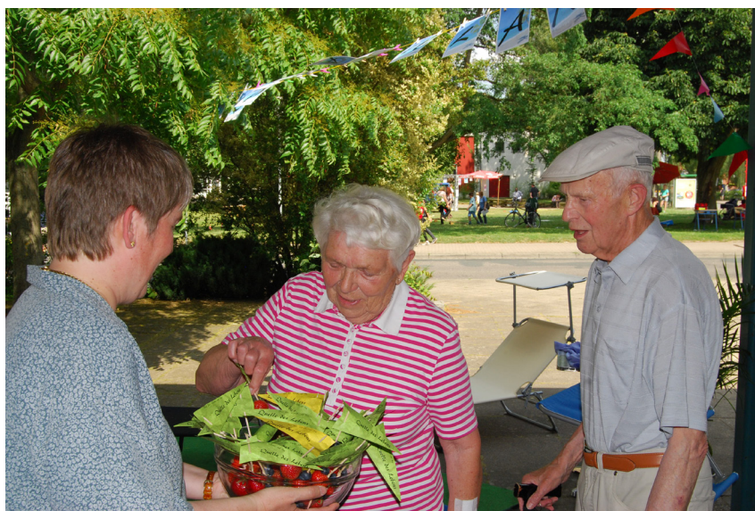
Ein Höhepunkt des KredO-Jahres war das Stadtteilstfest im Juli, das Kirchen-Team hatte an die „Copa Paulana“ eingeladen.

Bei sonnigem Wetter startet das KredO-Team gut gelaunt zu einer Radtour entlang der Landwehr. Im November folgt ein weiterer Teamtag, bei dem mit der Frage nach passenden Angeboten für