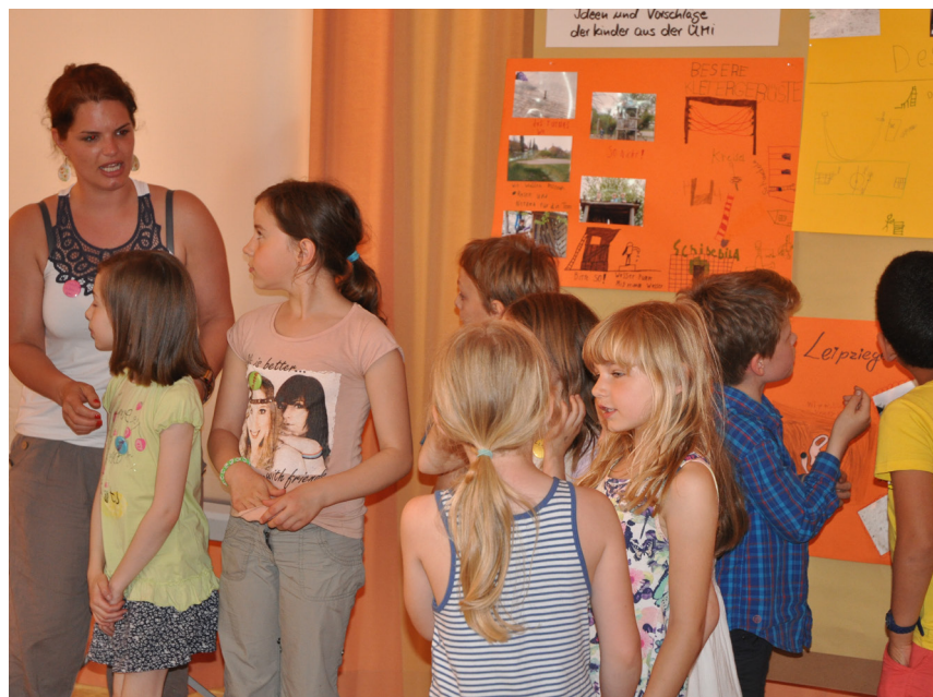
Vorschläge zur Verbesserung der Lebensqualität für Kinder auf dem Kreideberg wurden bei der Kinderkonferenz im KredO gesammelt.

Finanzierung des Baus für das Jahr 2015 beschlossen. Jetzt warten die Kinder gespannt auf den ersten Spatenstich für ihr Kinderlabyrinth. Bei allem wird deutlich: Es braucht viel Geduld und einen langen Atem,