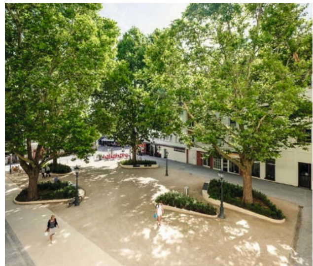
... und schattenverträglich.