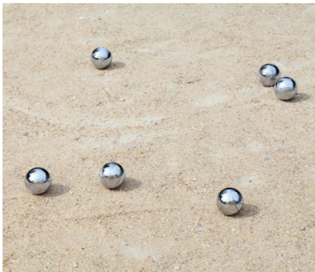
Der neue Belag des Thorer Platzes soll bespielbar sein...

☛ Die Migrationsprechstunde der Hansestadt findet montags von 11-13 Uhr im KredO statt. Auch hier wird um Anmeldung gebeten: 04131 – 309 4180.