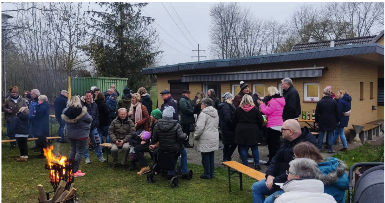
Die Gemeinschaft wird groß geschrieben unter den rund 100 Mitgliedern des Vereins.