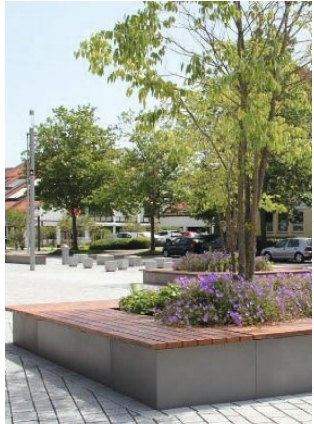
Beispiel für Sitzgruppe, diese dann jedoch mit Rücken- und Seitenlehnausstattung

Der erste Gestaltungsentwurf sah vor, nur die dunklen Betonplattenstreifen (in Summe ca. 180 m 2 ) auf dem Platz aufzunehmen und durch ein versickerungsfähiges Pflastersystem auszutauschen und damit zu entsiegeln. Nach Anpassung der Planung soll nun in der Platzmitte stattdessen eine kompakte Fläche in dieser Größe als sogenannte wassergebundene Decke hergestellt werden. Derartige Wege- und Platzbefestigungen kennen wir mittlerweile aus vielen anderen Bereichen und Städten, auch im Kurpark sind Wege und Plätze daraus hergestellt. Die Befestigungsart hat sich bewährt und bietet neben einer guten Entwässerung- und Versickerungsfähigkeit des Materials z.B. auch noch die Möglichkeit an, auf ihr Boule spielen zu können.