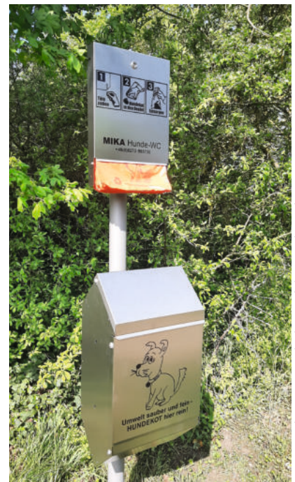
Neu: Hunde-WC am Bolzplatz auf dem Krähornsberg.