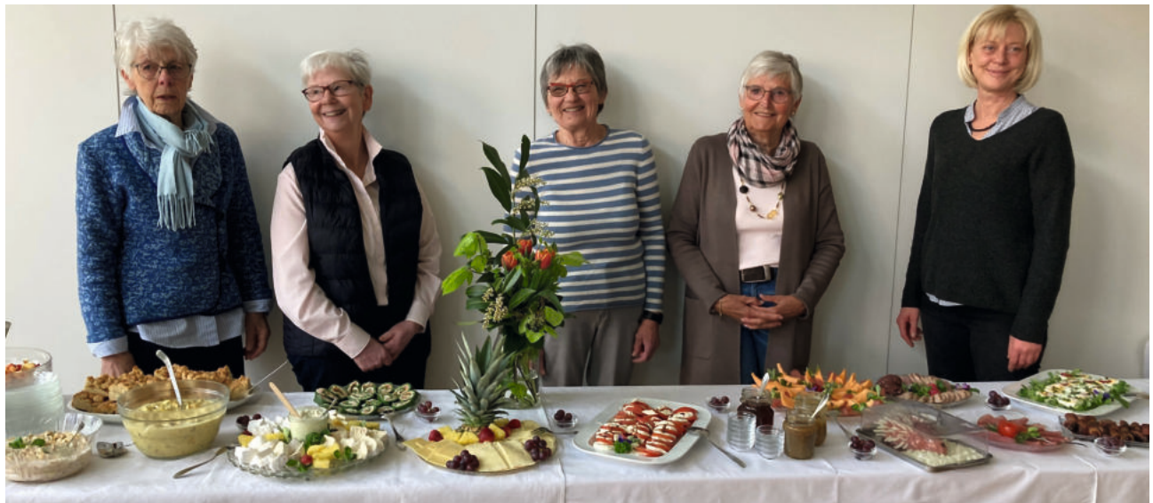
Diese Ehrenamtlichen gehören zum Team des Geburtstagsbrunch im KredO.

Ja, auch für die Seele wird gesorgt mit einer Andacht und einem kleinen Programm, die von den Pastoren im Wechsel gestaltet werden. Interessant waren z.B. in diesem Jahr schon die Gedanken zu Vorbildern. Es wird viel erzählt, auch gesungen und gelacht. Das größte Kompliment für das Team ist, dass viele Gäste Jahr für Jahr wiederkommen. Dass es sich herumspricht: Im KredO ist man willkommen und lässt es sich gut sein! Pastorin Kerstin Herrschaft